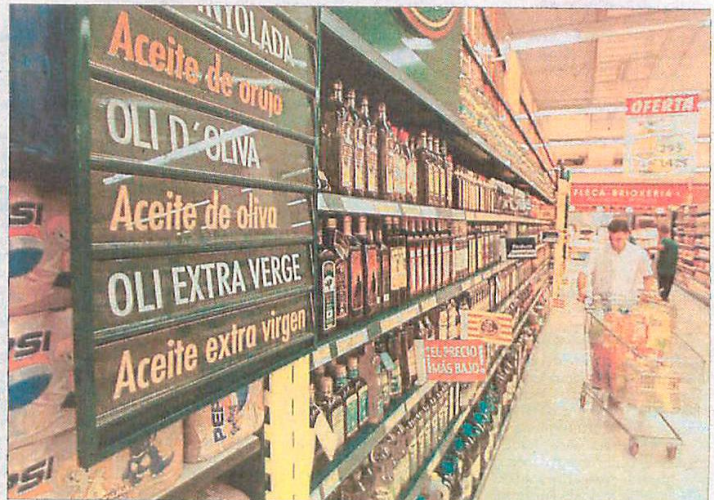
El aceite de oliva es uno de los productos básicos de alimentación en España